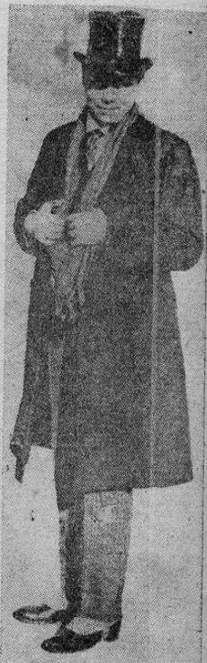
Doctor don Enrique Olaya Herrera, candidato de la Concentración Nacional de Colombia, y quien según todos los informes que llegan a Bogotá, ha sido electo presidente de aquella República