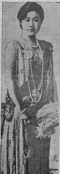
La reina de Siam acaba de cumplir veinticinco años. Para la recepción celebrada con tal motivo, vistió un elegante traje occidental, como se ve en esta fotografía